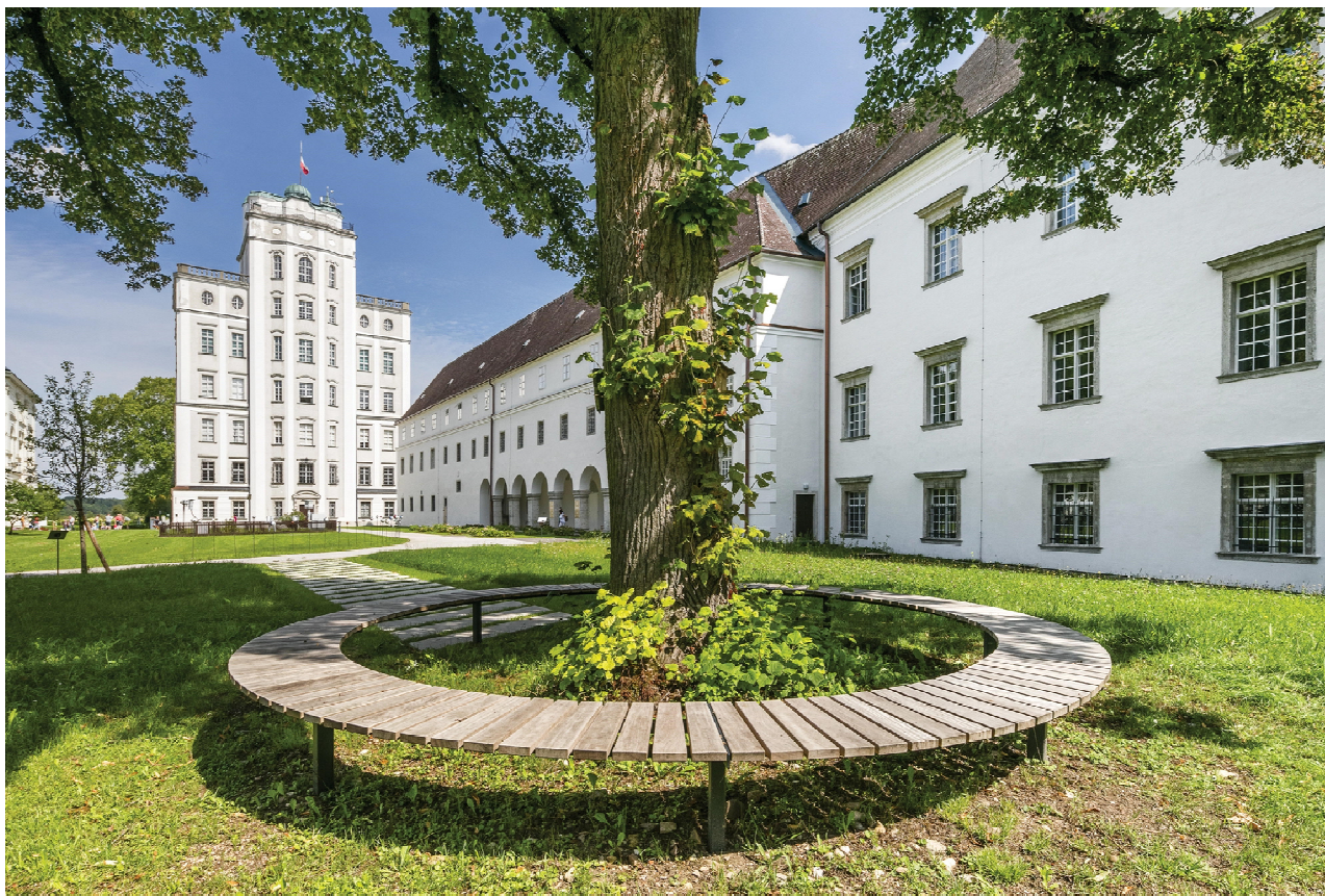
Příklad řešení – kruhová lavička kolem Lípy mezi kostelem a farou