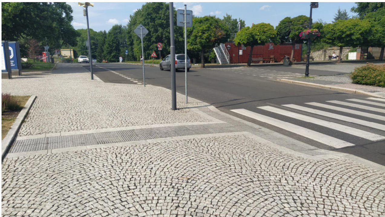
Příklad řešení povrchů - chodníky (sousední autobusové nádraží, stávající chodníky)