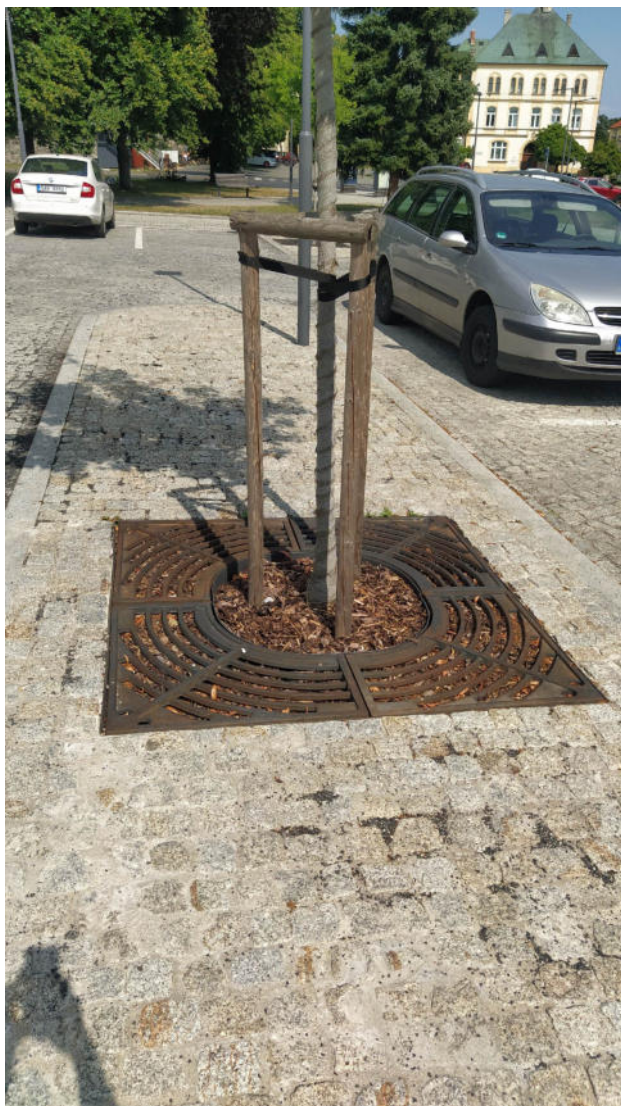
Příklad řešení – mříž u stromu