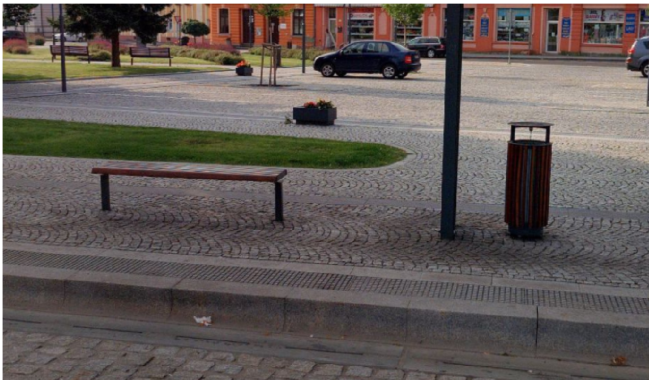
Příklad řešení – standardní městské lavičky, odpadkový koš