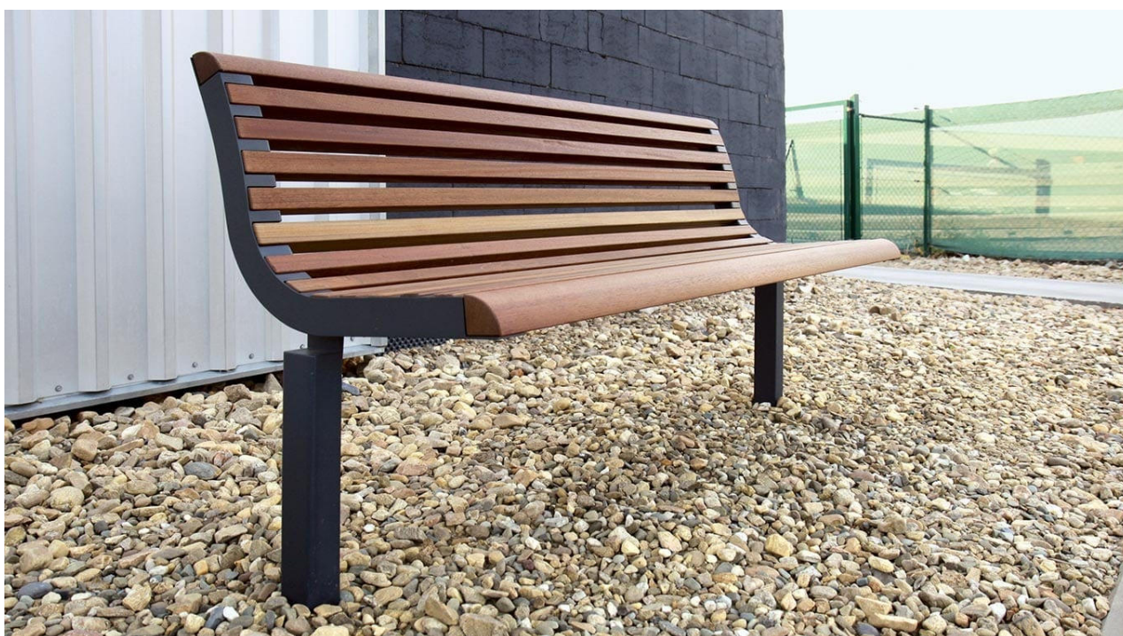
Příklad řešení – standardní městské lavičky