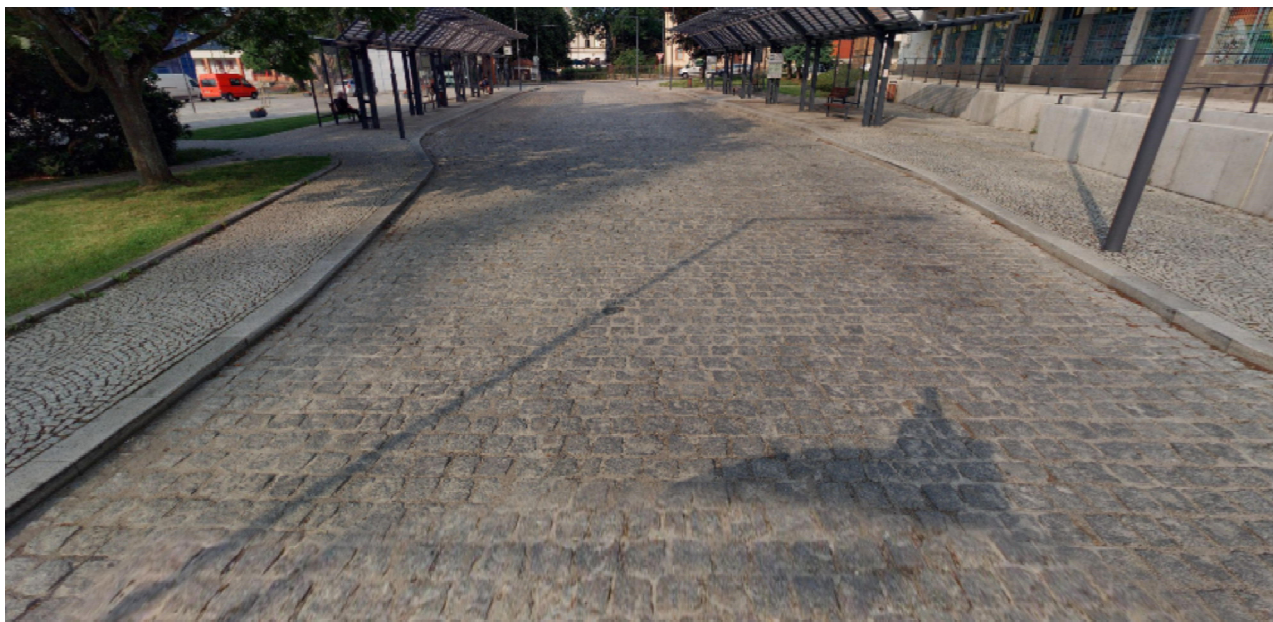
Příklad řešení povrchů (sousední autobusové nádraží)

- plocha komunikace ul. Národní a ul. Legií - žulové kostky 10/10