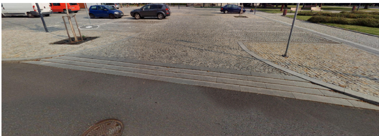
Přejezdové prahy – žulové výškově odstupňované obrubníky – budou řešeny na vjezdu na komunikaci po obvodu náměstí z ulice Národní a ulice Legií

- plocha komunikace ul. Národní a ul. Legií - žulové kostky 10/10