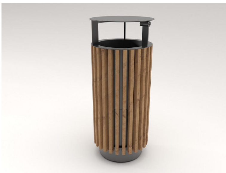
Příklad řešení – standardní městský odpadkový koš