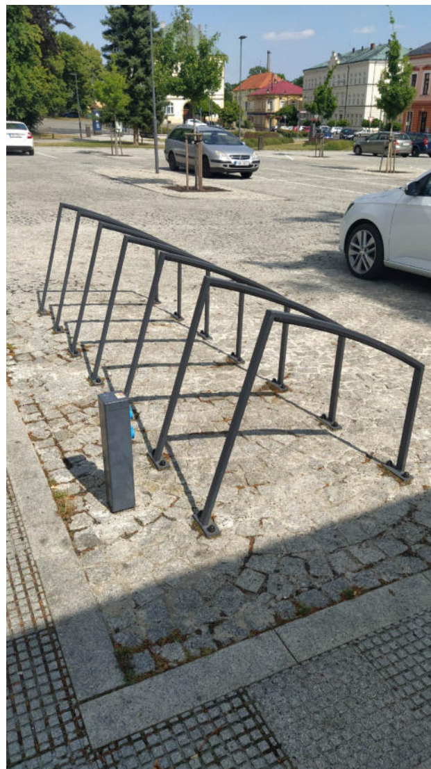
Příklad řešení – stojan na kola